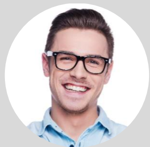
Przedsiębiorca z sektora MŚP

Przedsiębiorca składa w banku kredytującym wniosek o udzielenie gwarancji wraz z załącznikami