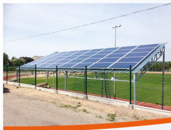
Instalacja fotowoltaiczna w Gniazdowie