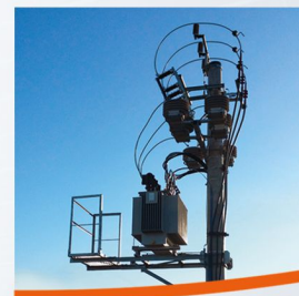
Stacja trafo słupowa w Zawierciu