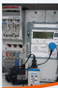
Modernizacje i odczyty układów pomiarowych