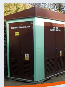
Stacja trafo kontenerowa w Olsztynie