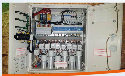
Zabudowa baterii kondensatorów w Choroniu