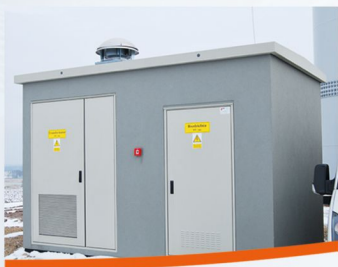
Stacja transformatorowa i wiatrak 2 MW w Kamienicy Śląskiej